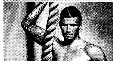
DAVID BECKHAM SIGUE LOS PASOS DE VICTORIA