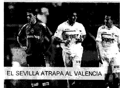
EL SEVILLA ATRAPA AL VALENCIA